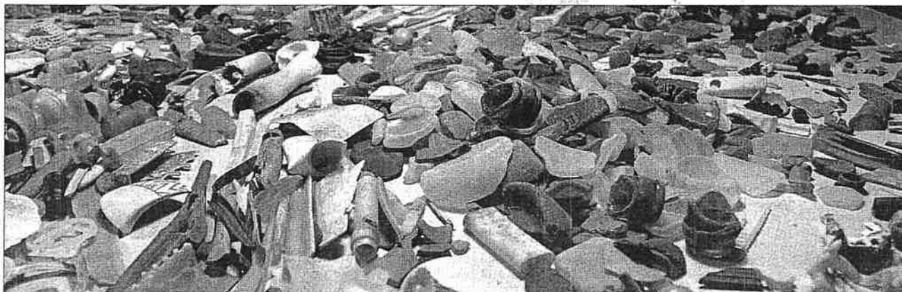
Funn fra en strand, gjort av kunstneren Simryn Gill.