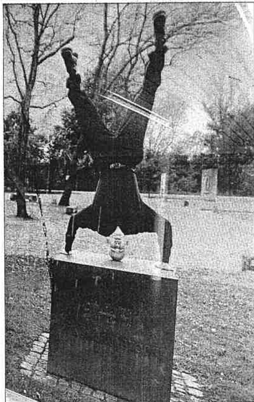
Cildo Meireles: «Atla, for manzoni ond Galileo»

Forhåndsbest. man/te 9-14 Tlf: 76 05 61 00 Billetsalget starter 45 minutter for første forestilling. Uavhentede reserverasjoner slettes 15 minutter før forestillingen.