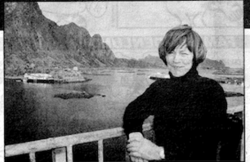
I løpet av dagen blir det mange turer opp på Svinøybrua for å betrakte kunstverket.

— Jeg forstår at dette kan ha et greit skjær av unødvendighet over seg,