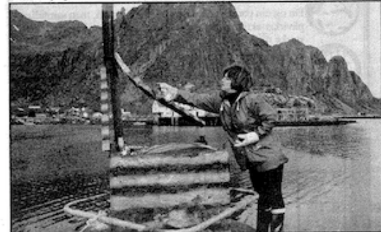
Skulpturen/installasjonen på «Østerleiskjæret» skal stå til vær og vind tar den.

— Jeg var her i april, på en dag med snø og tung tåke. Jeg så ikke særlig til Lofot-fjellene, men jeg la merke til det hjelpeløse skjæret, sier bil-