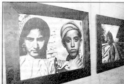
Marius Holts fotografier «India 1993» og «Melankoli over tidens flyktighet».