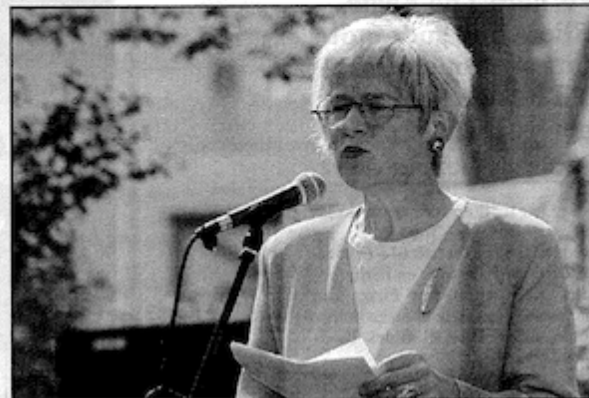
Statssekretær Iren Valstad foretok den offisielle åpningen av Kunstfestivalen i Lofoten.