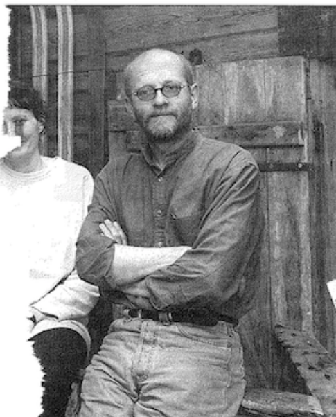
at samling av gamle gjenstander – et raritetskabinett.