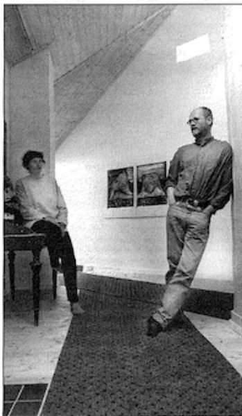
Glimt fra det nyåpne- de Galleri Lille Kabelvåg med KNIV- utstil- ling un- der Kunst- festivalen i Lofoten.