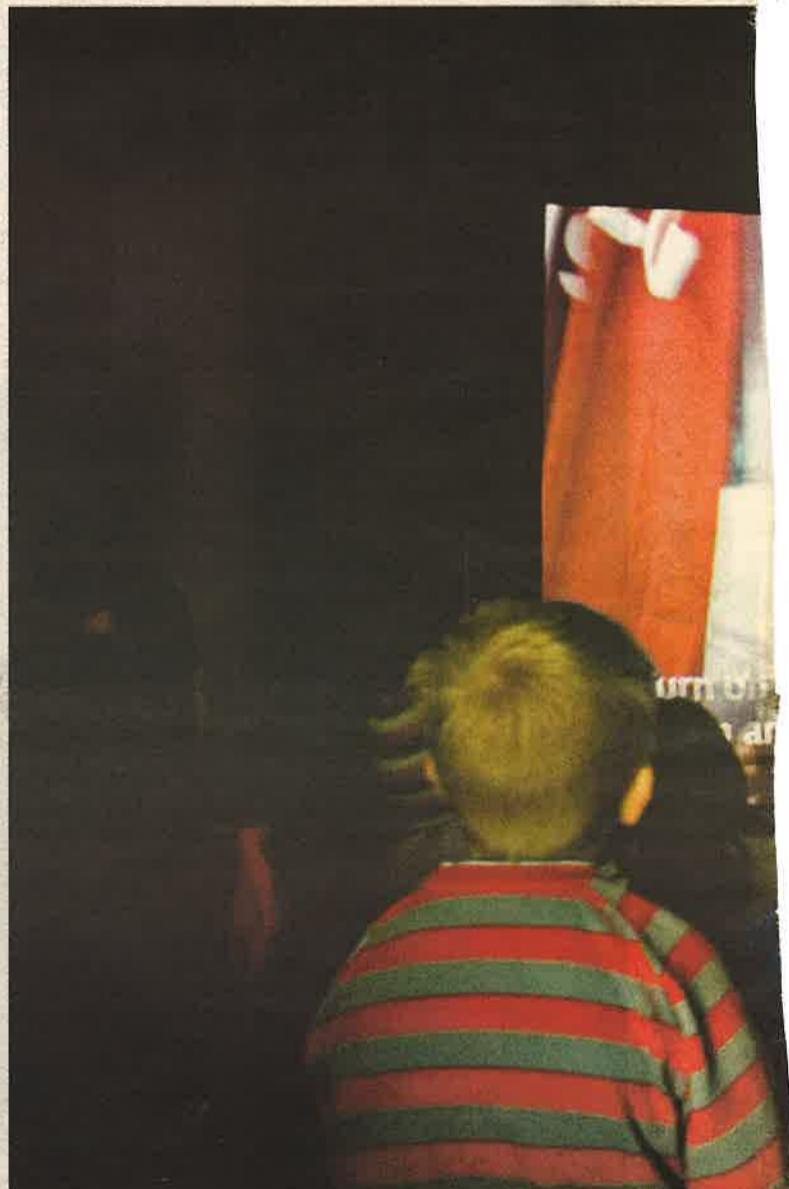
Skolebarn møter skolebarn. Dette var en av scenene elevene bet seg merke i.