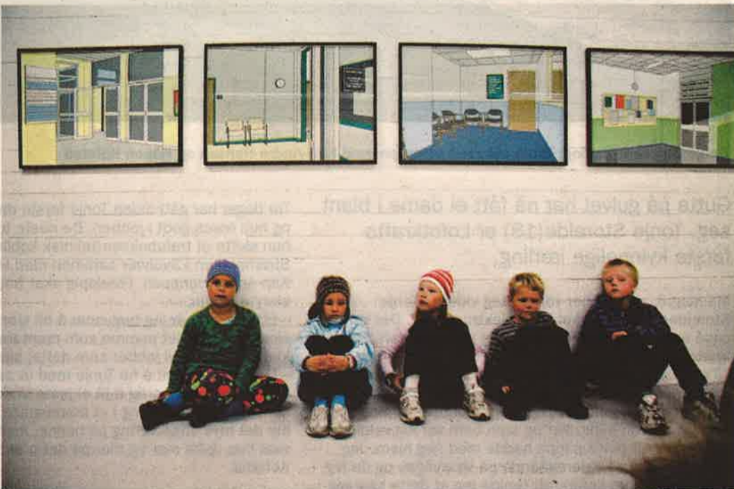
Hvorfor huset ikke har vegger? For å utsiktens del, så klart.